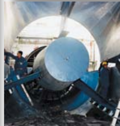
Bild oben Projektierung, Konstruktion, Herstellung und Montage – bei FAIST Anlagenbau alles aus einer Hand.