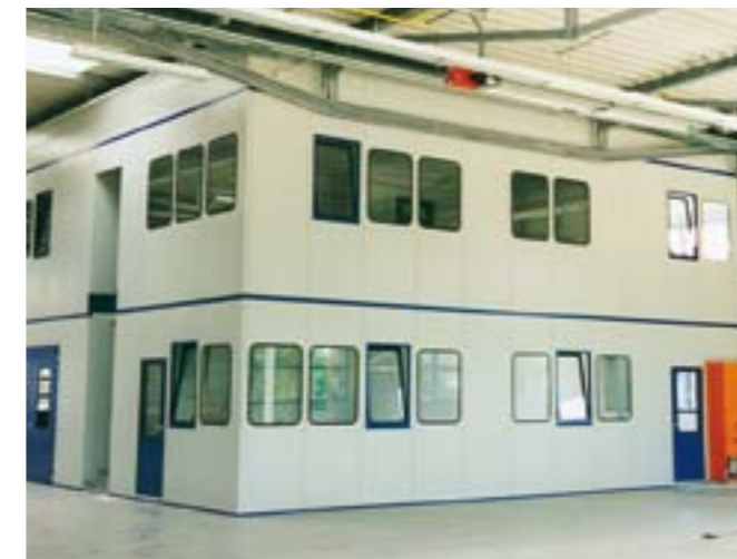
Bild unten Schallschutzkabine für Bohrwerk, Schalldämmung 25 dB Liebherr, D-Biberach