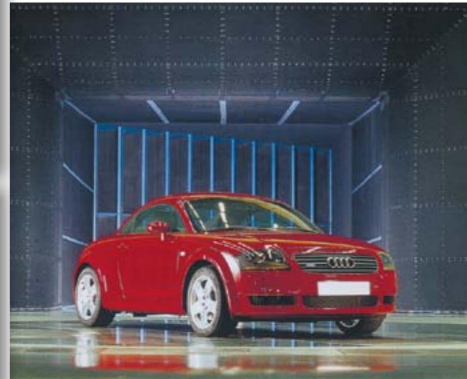
Vliesbeschichtet und absorbierend – die Verkleidung am Kollektor des Windkanals.