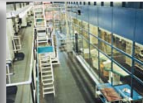
Bedienleitstand an Zeitungsdruckmaschine, Schalldämmung 28 dB MVD, D-Potsdam