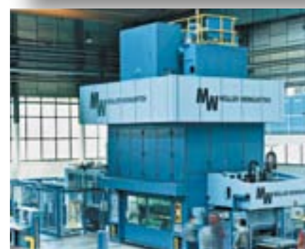
Schallschutzverkleidung für Presse, Schalldämmung 22 dB Renault, F-Le Mans