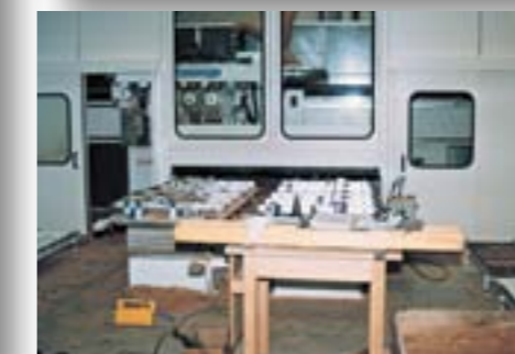
CNC Oberfräse in der Holzverarbeitung mit Schallschutz, Schalldämmung 26 dB