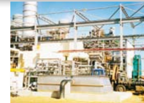
Bild rechts Eine genaue statische Berechnung ist Basis für unsere Stahlkonstruktionen.