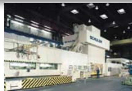
Schallschutzkabine für Stufenpresse und Bandanlage BMW, D-Dingolfing