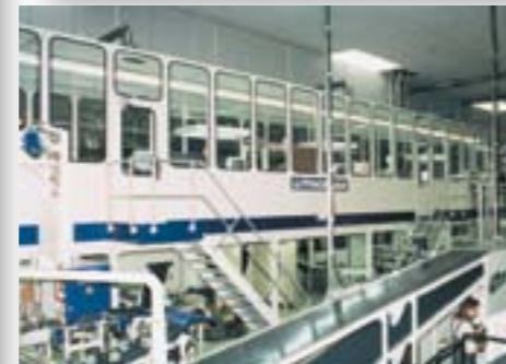
Bedienleitstand an Akzidenzdruckmaschine, Schalldämmung 28 dB Strohal Druck, AT-Müllendorf

Nur wer die Anforderungen genau kennt, kann kundenfreundliche Lösungen bieten. Dies gilt besonders für Projekte aus dem Kraftwerksbereich. Durch jahrelange Erfahrung in dieser Branche haben wir heute ein Schallschutzsystem, das den hohen Ansprüchen unserer Kunden gerecht wird, wie z.B. die Demontier-