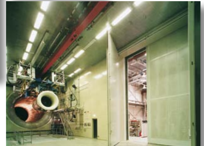
Schallschluckende Auskleidung und hochdämmende Tore im Turbinenprüfstand.