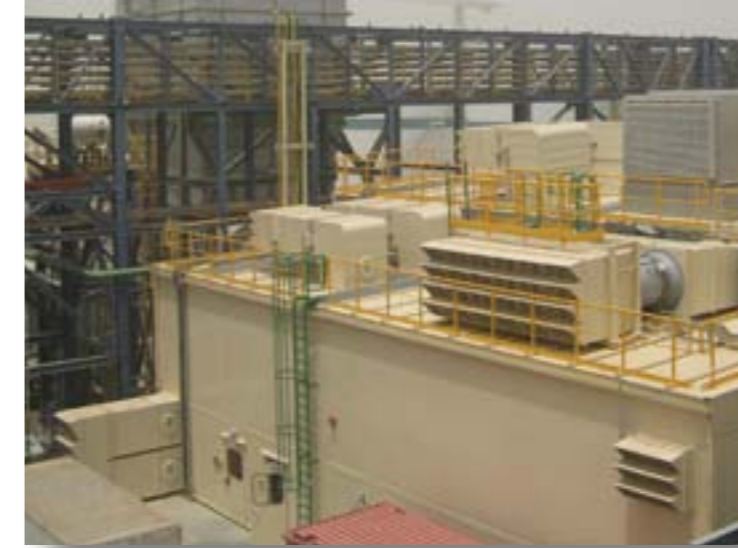
Schallhaube mit Belüftungssystem für Gasturbine GT 13, outdoor; Alstom AG; Projekt Az-Zour, Kuwait