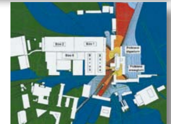
Akustische Berechnungen sind unsere Basis für die Konstruktion der Schallschutzanlagen.