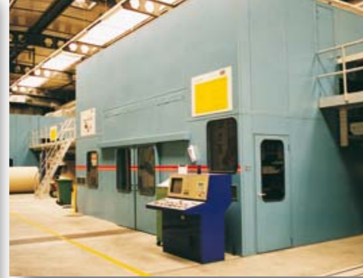
Schallschutzkabine für Wellpappeanlage, Schalldämmung 25 dB Model AG, CH-Weinfelden